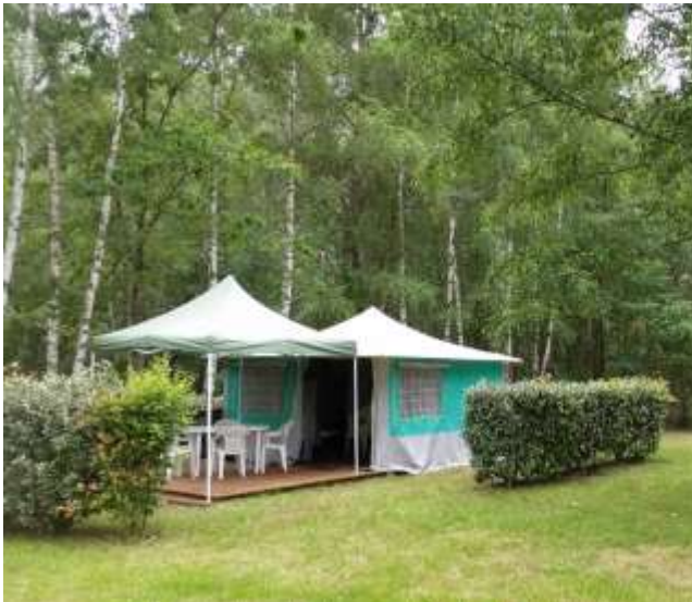
Avec barnum de 9 m 2