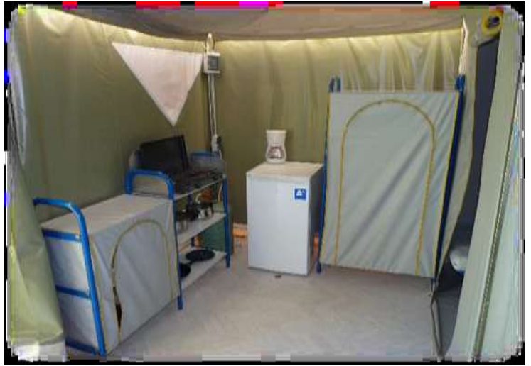
Micro-ondes à la place de la cafetière