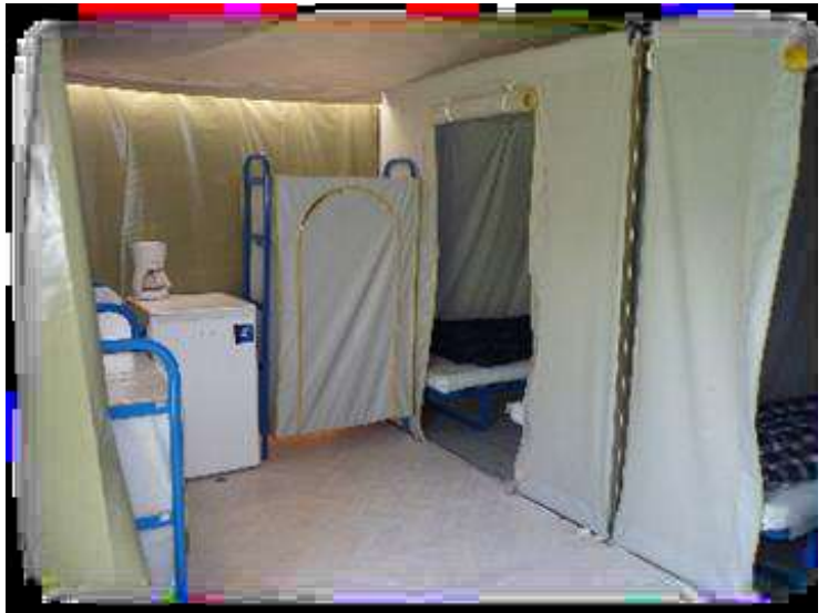
Micro-ondes à la place de la cafetière