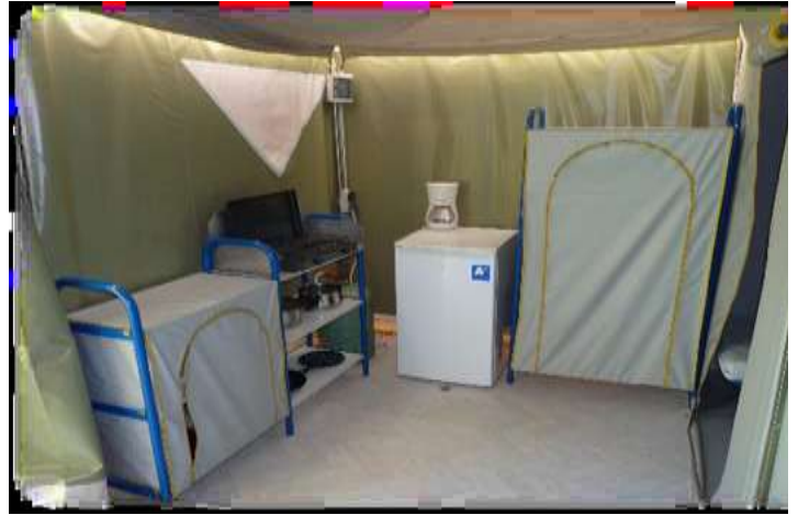
Micro-ondes à la place de la cafetière