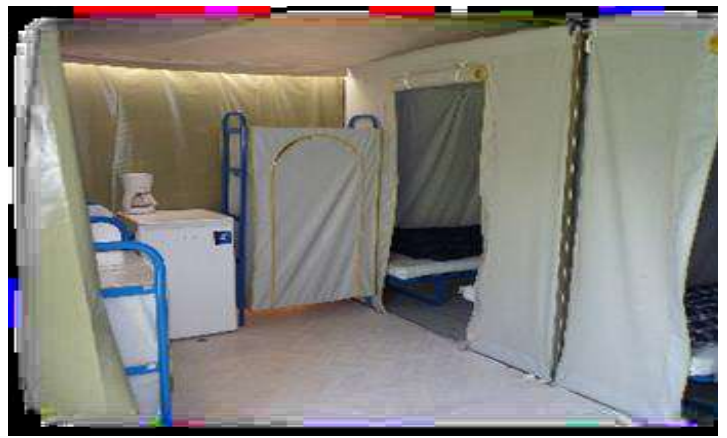
Micro-ondes à la place de la cafetière