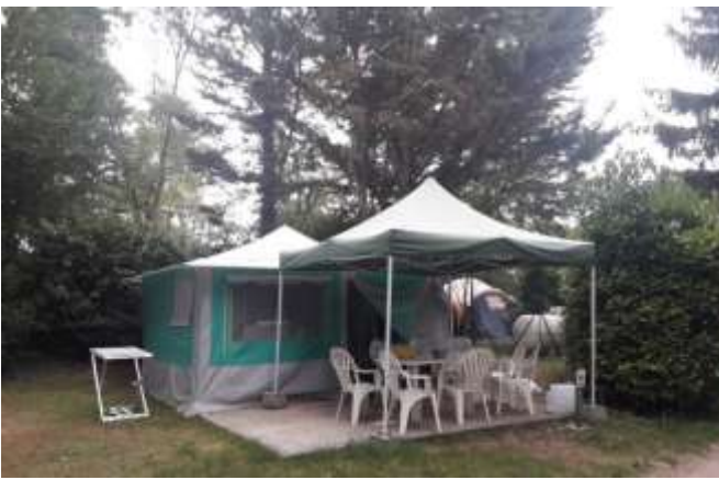
Avec barnum de 9 m 2